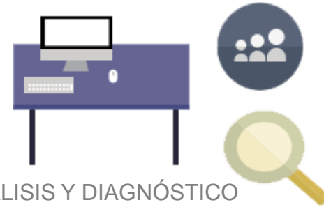
ANÁLISIS Y DIAGNÓSTICO Diagnóstico de potencial exportador